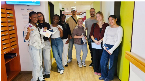
Accueil des nouveaux apprentis en août 2025. Ils font partie des 18 apprentis formés par la fondation.

Cela implique de continuer à investir dans la formation, dans l'accompagnement des équipes, dans des outils qui facilitent la communication, mais aussi dans des espaces de réflexion permettant de donner du sens à notre action.